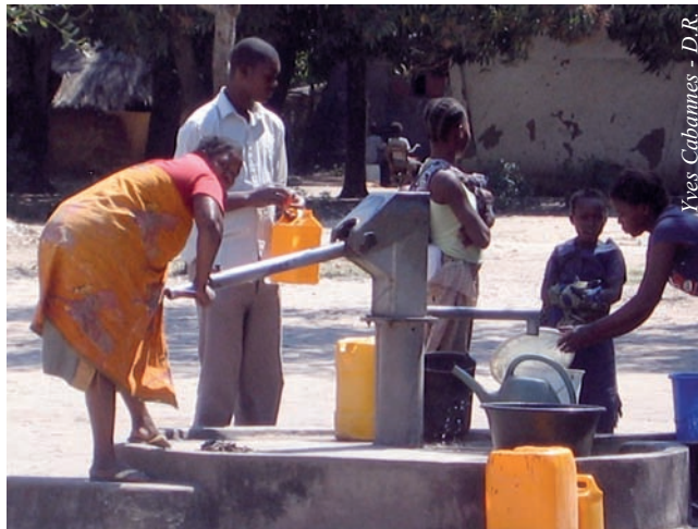
Africités a décerné l'un de ses prix à Dondo (Mozambique) pour la qualité de son budget participatif.

Durant ces vingt dernières années, les budgets participatifs, nés au Brésil, ont connu une rapide expansion, accompagnée d'une forte diversification. En 2009, plus de 1200 municipalités dans le monde ont mis en place ce mécanisme (ou processus) par lequel les populations