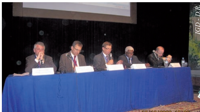
Workshop co-organisé par le FEC au Maroc (Fonds d'équipement communal) et l'IGD pour la promotion du « Guide pour l'autoévaluation financière des autorités locales ».