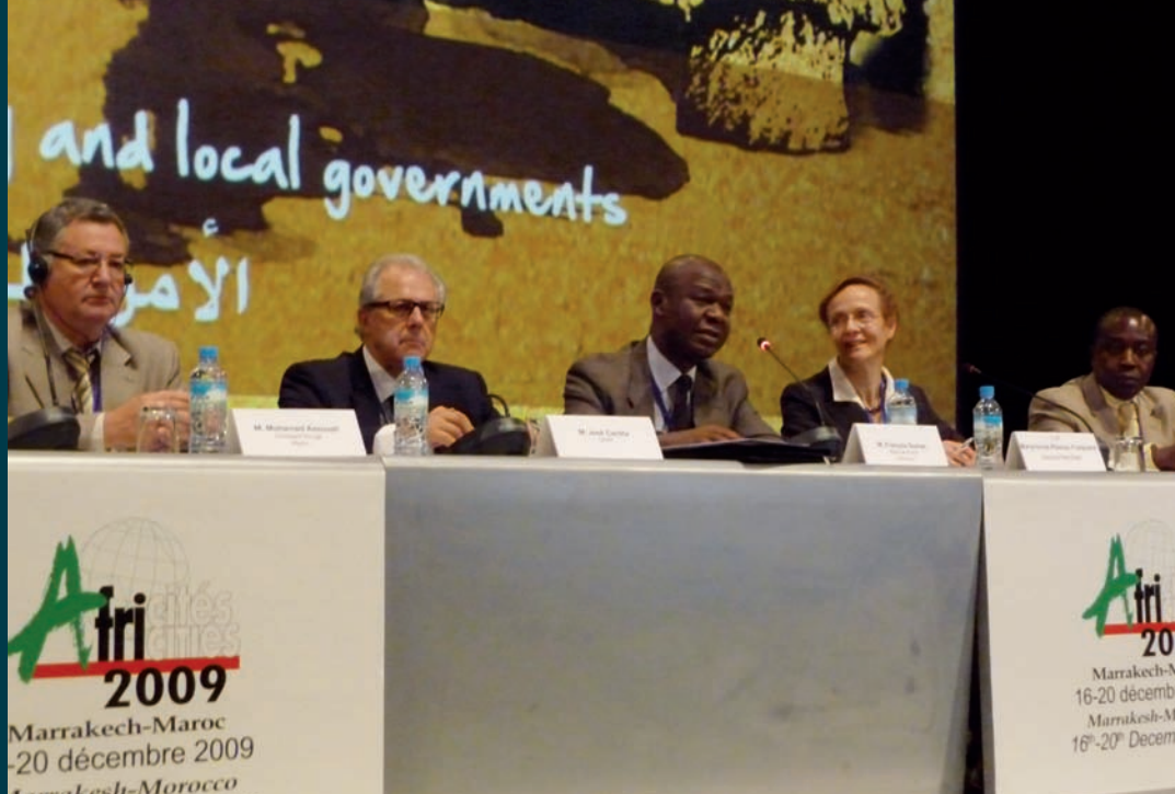
Cinquième édition du sommet des collectivités locales, "Africités", Marrakech, 16-20 décembre 2009.