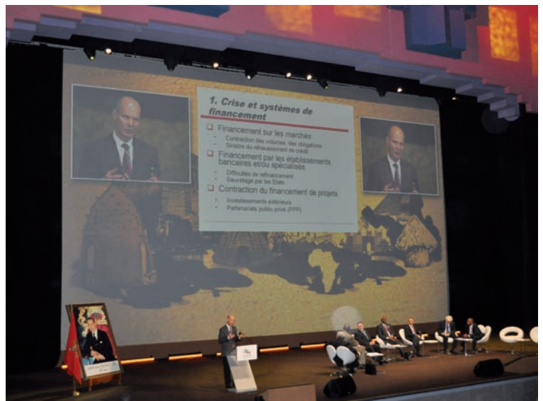
Séance plénière des journées politiques, Africités 5 .

Au total, le programme de réformes auquel sont confrontés les gouvernements et les collectivités locales d'Afrique sub-saharienne est chargé. Il sera facile aux sceptiques d'émettre des doutes sur l'appétit des États et des sociétés africaines à réformer, même sous la pression de l'urgence, les mécanismes de financement d'un secteur où jusqu'à présent l'inertie, la résistance aux changements et l'accaparement par les élites semblent avoir largement prévalu. Mais les sociétés et les économies du continent viennent de manifester, pendant la crise économique mondiale, des capacités d'adaptation et de réaction qui laissent penser, au contraire, que le moment est venu d'engager cet agenda. ■