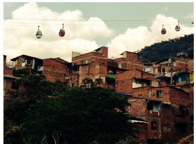
Metrocable - Medellín, Colombie

Le Secrétariat technique présentera le rapport général de sa présence au FUM lors de la restitution prévue le 13 mai 2014.