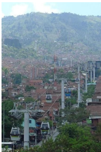
Metrocable - Medellín, Colombie

Installé par la communauté urbaine colombienne de Medellín en complément au métro, le Metrocable a permis de désenclaver les quartiers tout en préservant les espaces naturels existants.